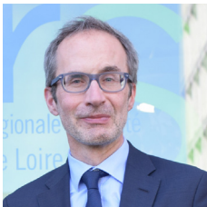
Laurent Habert, directeur général de l'ARS Centre-Val de Loire

Confrontés aux problématiques de démographie médicale, d'accès aux soins et de vieillissement de la population sur une large partie du territoire régional, les acteurs locaux et partenaires de l'ARS Centre-Val de Loire se sont pleinement mobilisés autour du volet investissement du Ségur de la santé pour réfléchir aux projets à même d'apporter des réponses concrètes au bénéfice de la population.