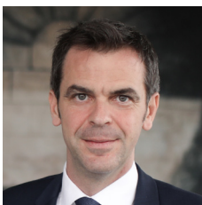
Olivier Véran, ministre des Solidarités et de la Santé

Nous l'avions promis, nous l'avons fait, ensemble. Sept mois après avoir annoncé le montant d'investissement dédié à la Région par le Ségur de la santé, l'ARS Centre-Val de Loire a élaboré sa stratégie régionale des investissements en santé pour la période 2021-2029.